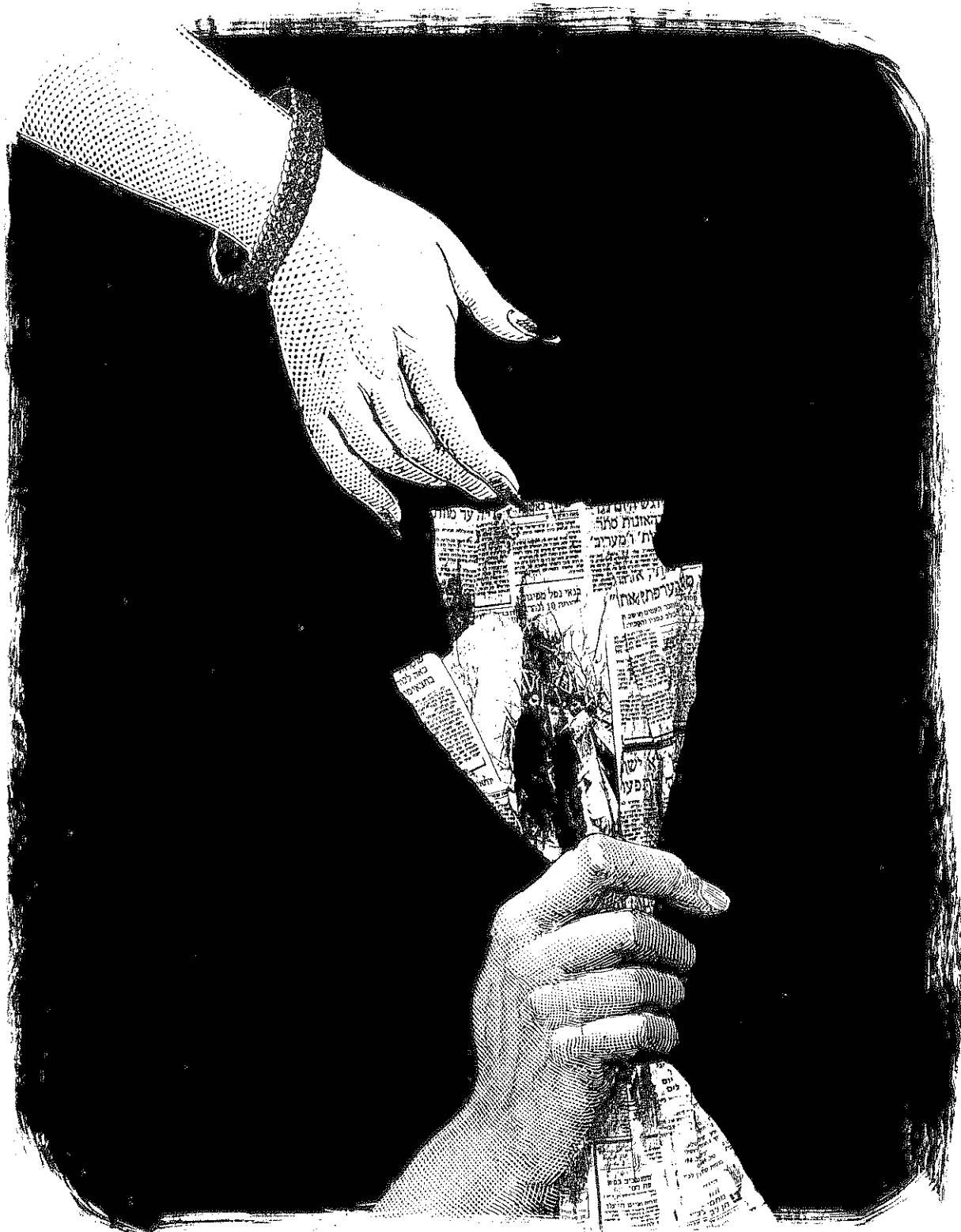
אילוסטרציה: אריאל זילבר

ברשת המקומונים ידיעות תקשורת, בעוד ששלוש שנים קודם לכן הגיע חלקן של הנשים באותה רשת ל-4.44% ואילו בעשרה מבין מקומוני רשת עתונות מקומית (בתוכם המקומונים הגדולים העיר, כל העיר, צומת השרון וכלבו) היו הנשים 52.3% מכלל 260