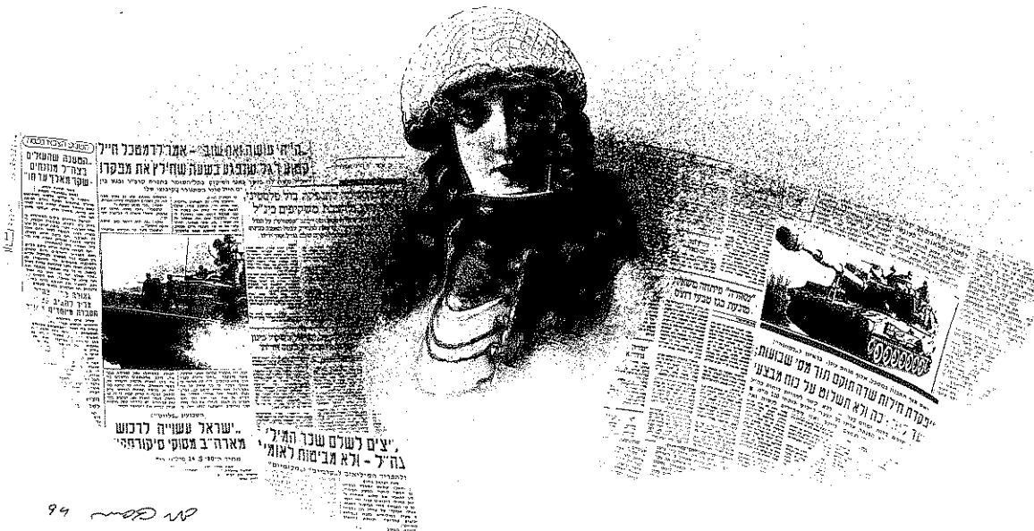
נשים ממלאות היום את כל התפקידים העתונאיים, כולל כתבות צבאיות

חוקרים אמריקניים כבר הצביעו על כך כי "יותר נשים (מאשר גברים) מחפשות תכניות לא מסורתיות של עתונות כבסיס